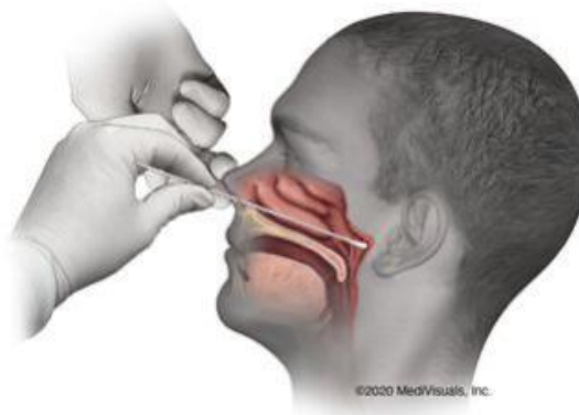
Gambar 1: Batang swab dimasukkan melalui rongga hidung sehingga ke nasofarink