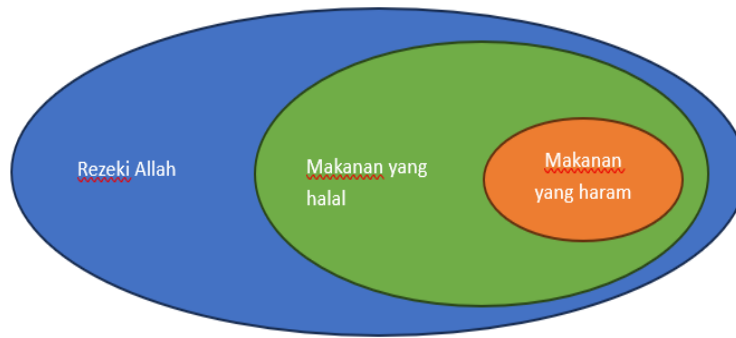
Rajah 1: Rezeki Allah SWT dalam al-Quran

Makanan yang halal merujuk kepada jenis makanan atau produk yang sah untuk dimakan oleh individu Muslim. Pada umumnya, makanan yang dianggap halal haruslah dengan jelas dinyatakan dalam al-Quran dan hadis. Manakala makanan yang haram adalah segala sesuatu yang dilarang dalam al-Quran dan hadis 339 . Hasil analisis keatas ayat-ayat makanan dalam al-Quran, penulis mendapati bahawa Allah SWT menyebut ciri-ciri makanan yang haram lebih terperinci berbanding makanan yang halal kerana menurut Al-Zuhaili jumlah makanan yang haram lebih sedikit berbanding makanan yang halal dimakan 340 . Al-Razi pula menyatakan bahawa hikmah Allah meletakkan limitasi dalam pengambilan makanan adalah untuk mengelakkan manusia makan berlebih-lebihan sehingga membawa kepada kemudaratan 341 .