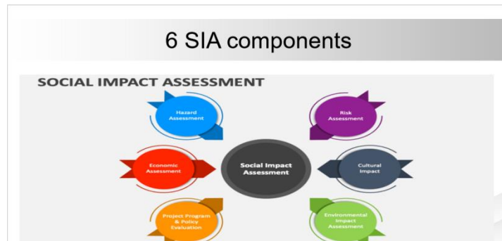
Rajah 1: 6 Komponen penilaian impak social