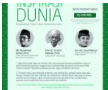
Seminar Al-Quran Nasional: Pendidikan Al-Quran Inspirasi Dunia