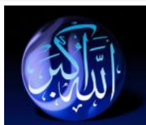
Lautan Makna di Balik Takbir