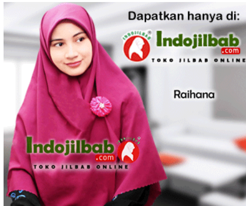
Iklan negatif? Laporkan!

Langganan Pasang Disqus di website Anda Privasi