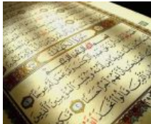
Keutamaan Tilawah Al-Qur'an