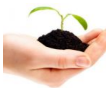
Makna Memberi dan Menahan Diri