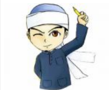
Saudaraku, Janganlah Mengkerdilkan Makna Dakwah