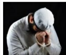
Aku Menangis Bersama Al-Quran