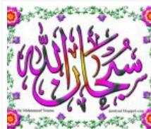
Lautan Makna di balik Tasbih