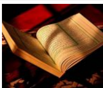
Bagaimana Hukum Membaca Doa Khatam Al-Quran?