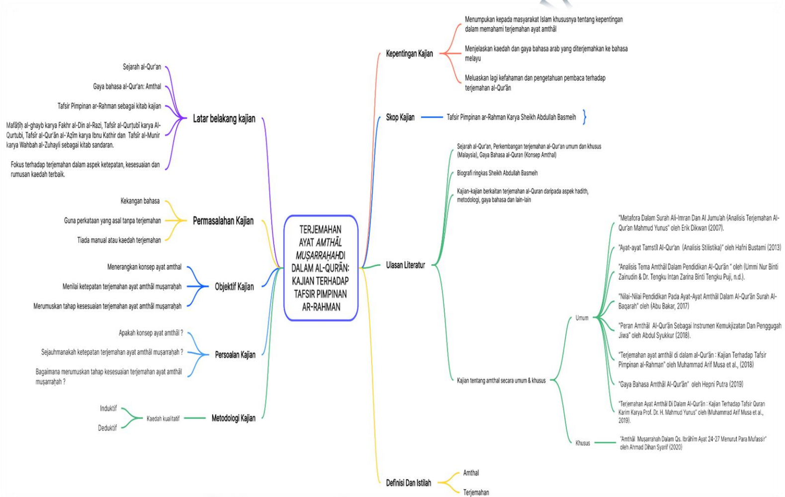
Rajah 1:2: Terjemahan Ayat Amthāl Muşarraĥah di dalam al-Quran berdasarkan Tafsir Pimpinan Ar-Rahman