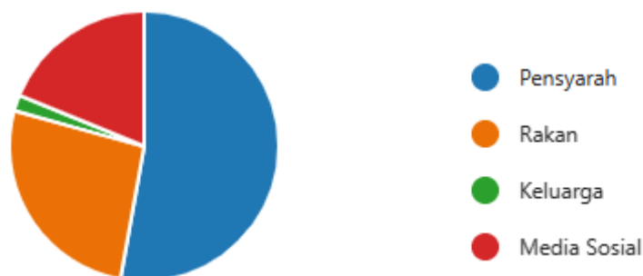
Rajah 1: Rumusan Cadangan Penggunaan Laman Sesawang Sunnah.Com

Rajah 1 dibawah menunjukkan rumusan cadangan penggunaan laman sesawang Sunnah.com dari individu-individu tertentu, keluarga atau media sosial. Hasil kajian mendapati bahawa, para pelajar telah dicadangkan oleh para pensyarah untuk menggunakan laman sesawang ini dalam pencarian mereka berkaitan hadith-hadith Nabawi. Hal ini kerana para pensyarah yang lebih banyak memperkenalkan laman sesawang ini selain dari rakan-rakan dan juga maklumat-maklumat berkaitan laman sesawang ini yang diperoleh dari media sosial terutamanya Facebook.