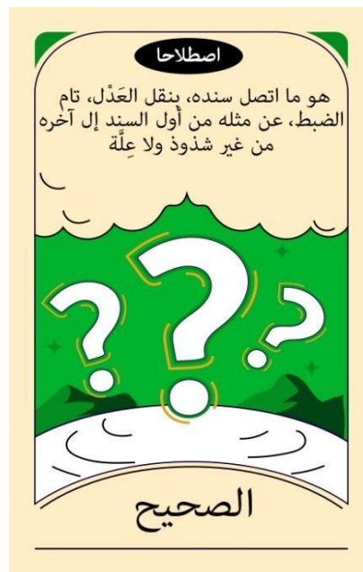
Rajah 7: Size Kad AsasDith (12.5cm x 7.cm)

Berdasarkan analisis dapatan kajian, kesepakatan panel pakar telah dicapai dalam menerima kesemua item yang dikemukakan oleh pengkaji, dengan nilai konsensus yang mencapai tahap signifikan yang tinggi. Justeru, hasil analisis ini telah berjaya menjawab persoalan kajian dengan membuktikan wujudnya konsensus kolektif dalam kalangan barisan panel pakar terhadap reka bentuk Kad AsasDith.