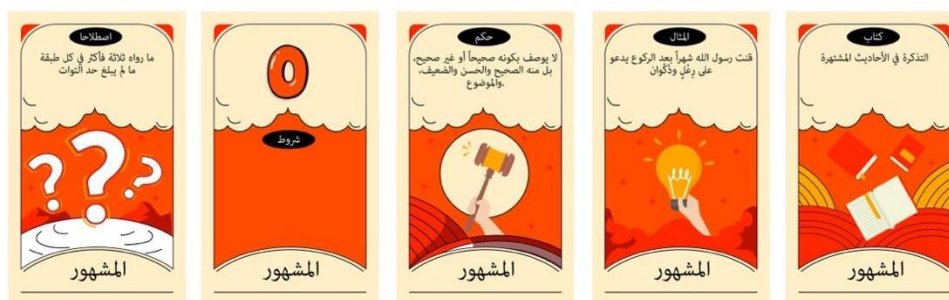
Rajah 4 Warna Kad AsasDith yang baru dicadangkan

Pengkaji telah mengubah Kad AsasDith yang berwarna kelabu kepada warna oren, namun kad yang berwarna oren menyerupai kad berwarna merah apabila kad ini telah siap dicetak.