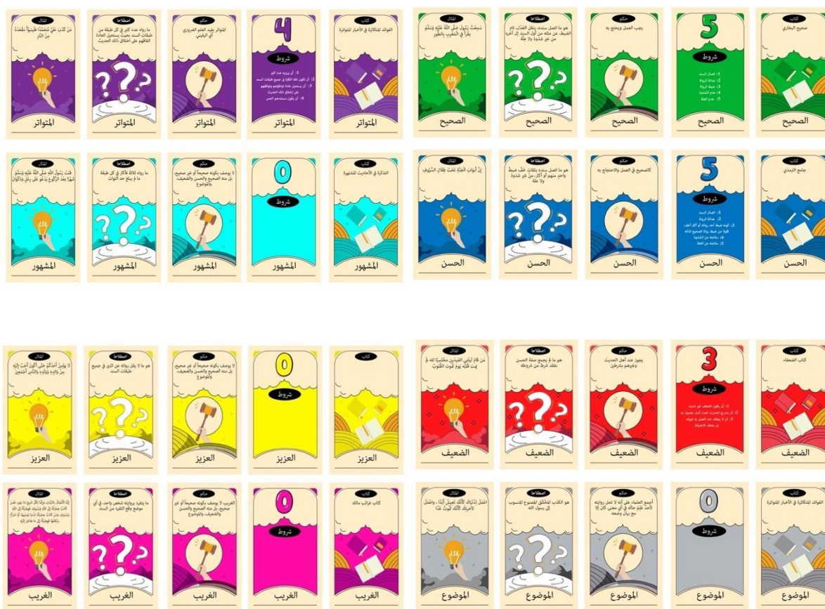
Rajah 8: Reka Bentuk dan Keseluruhan warna pada Kad AsasDith

Berdasarkan konsensus pakar, kerangka konstruk yang dibangunkan dan item yang di nilai ia telah membantu membangunkan Kad AsasDith yang mengintegrasikan gamifikasi di dalam pengajian hadis. Selain itu Kad AsasDith juga telah berdaftar di bawah Akta Hak Cipta 1987 Perbadanan Harta Intelek Malaysia (MYIPO) iaitu dengan nombor pemberitahuan pendaftaran CRLY2023W03079.