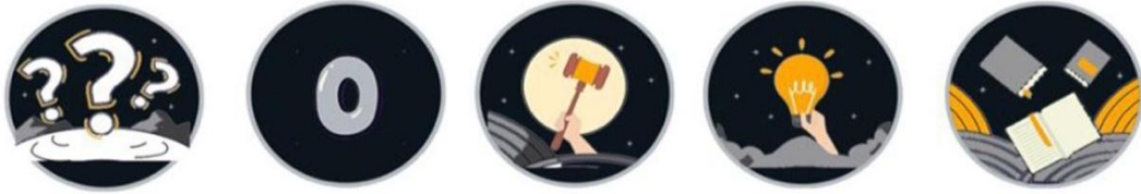
Rajah 6: Simbol pada Kad AsasDith

Bagi item “Pemilihan font yang digunakan adalah jelas” dan “Pemilihan jenis font Calibri yang digunakan adalah mudah untuk dibaca” yang merujuk kepada komponen Tulisan ( font ) mendapat nilai kesepakatan tinggi.