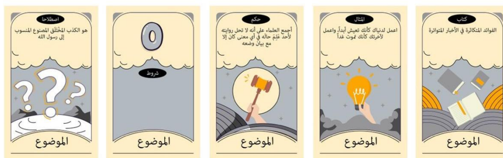
Rajah 3 Warna Kad AsasDith Yang Ditolak Oleh Pakar

Pengkaji telah mengubah Kad AsasDith yang berwarna kelabu kepada warna oren, namun kad yang berwarna oren menyerupai kad berwarna merah apabila kad ini telah siap dicetak.