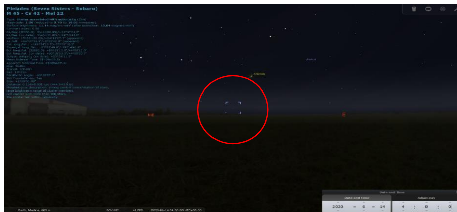
Rajah 3: Bintang Thurayya kelihatan terbit pada 14 Jun 2020M jam 4.00 pagi.

Bintang Thurayya kelihatan terbit di ufuk timur pada 14 Jun 2020 setelah dianjakkan masa 20 hari dari tarikh 25 Mei 2020 pada waktu yang sama sepertimana yang ditunjukkan pada Rajah 3.