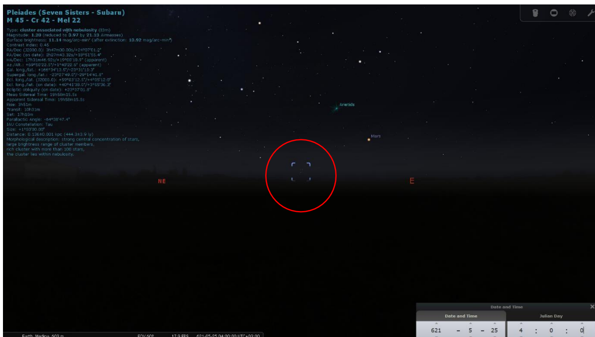
Rajah 1: Bintang Thurayya kelihatan terbit pada 25 Mei 621M jam 4.00 pagi.

Semakan kedudukan bintang Thurayya pada waktu subuh bulan Mei di Madinah dilakukan dengan menggunakan perisian Stellarium . Pada 25 Mei 621M iaitu 1400 tahun dahulu, bintang Thurayya kelihatan terbit di ufuk timur pada pukul 4.00 pagi di Madinah sepertimana yang ditunjukkan pada Rajah 1.