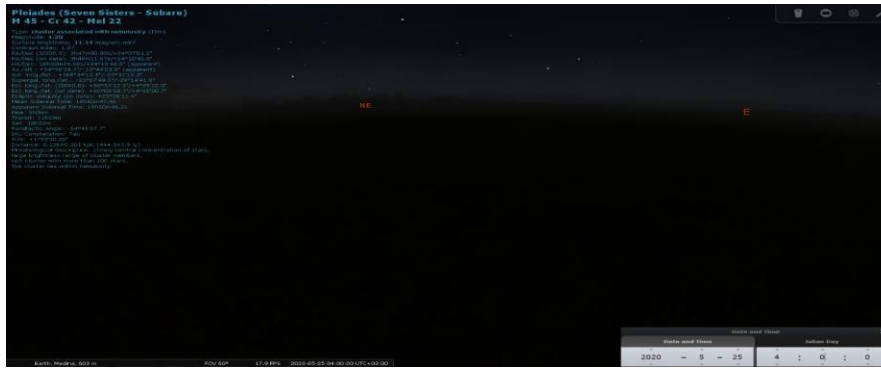
Rajah 2: Bintang Thurayya tidak kelihatan terbit pada 25 Mei 2021M jam 4.00 pagi.

Bintang Thurayya kelihatan terbit di ufuk timur pada 14 Jun 2020 setelah dianjakkan masa 20 hari dari tarikh 25 Mei 2020 pada waktu yang sama sepertimana yang ditunjukkan pada Rajah 3.