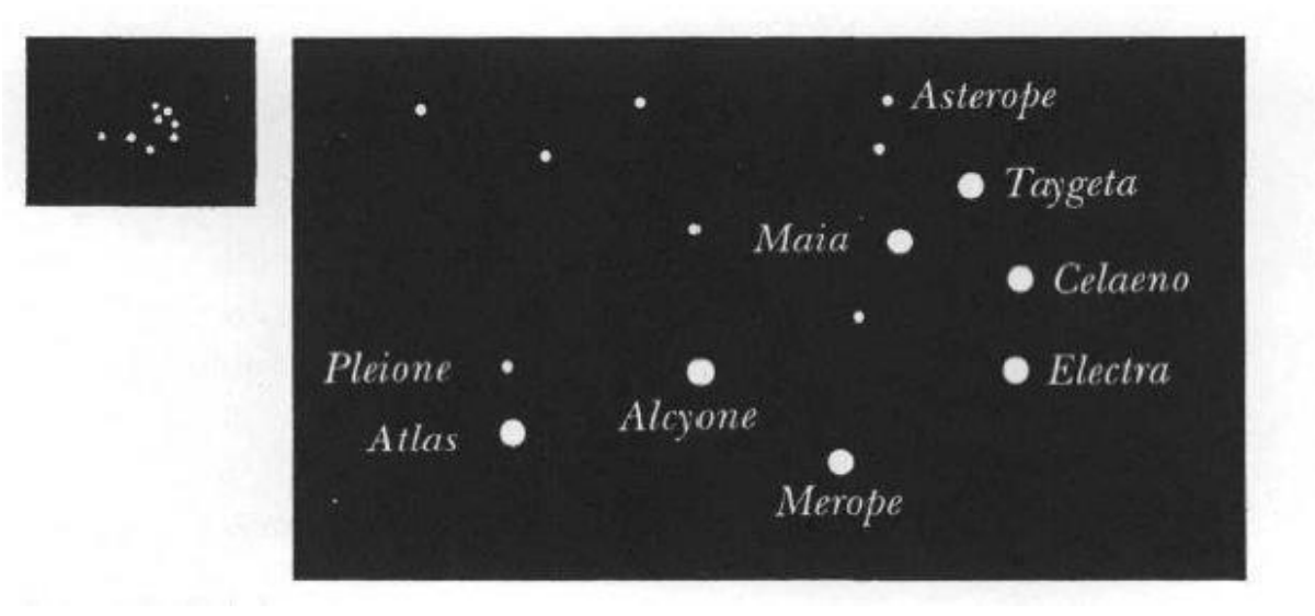
Rajah 1.1: Tujuh Bintang yang menerangi buruj Thaur (Kyselka, 1993)

Kemunculan Bintang Thurayya menandakan mulanya musim panas bagi orang Arab suatu ketika dahulu. Bintang ini akan muncul pada bulan Ayyar (Mei). Menurut al-Asfahani (al-Asfahani 1992), kebiasaan orang Arab menggunakan istilah al-Najm untuk merujuk kepada bintang Thurayya . Ini adalah merujuk kepada beberapa pentafsiran dalam al- Quran, bagi ayat pertama dalam Surah Al- Najm dan juga berdasarkan ayat ke-6 surah al-Rahman, yang menafsirkan bintang pada ayat tersebut adalah Bintang Thurayya . Bintang ini adalah sangat penting bagi Masyarakat Arab kerana merupakan salah satu petanda atau petunjuk bagi pertukaran musim yang dikenali sebagai al- Naw/ al- Anwa' yang termasuk dalam salah satu 28 bintang yang berada pada laluan bulan pada setiap hari yang dikenali sebagai manazil al-qamar (lunar mansion) (Raihana, 2016).