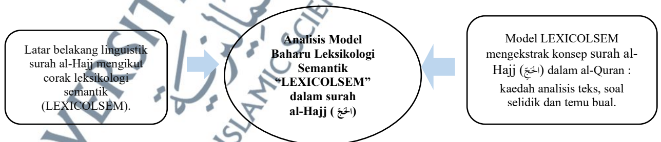
Rajah 1.2: Cadangan Rangka Kerja Penulisan Tesis Untuk Keseluruhan Tesis.

Kesimpulannya, rangka kerja tesis yang dicadangkan adalah seperti rajah berikut: