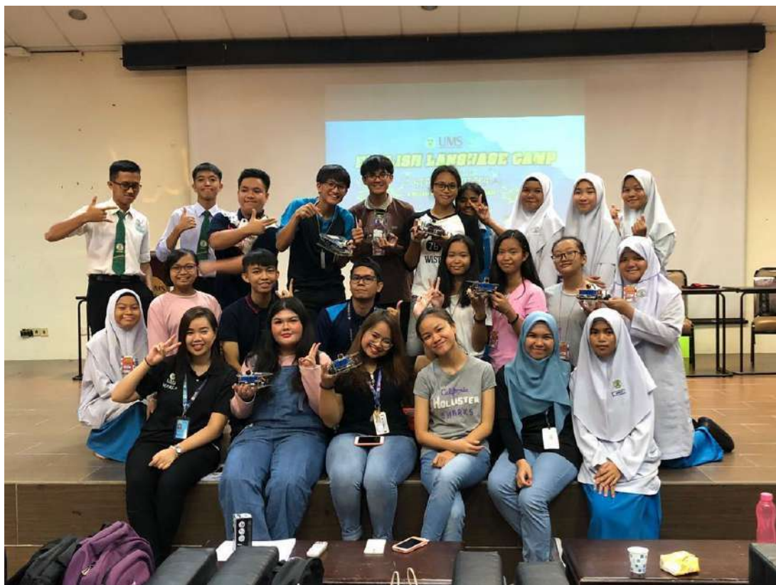
Gambar 20: STEM AMBASSADOR bersama pelajar Pogram English Language Camp with Integration of STEAM