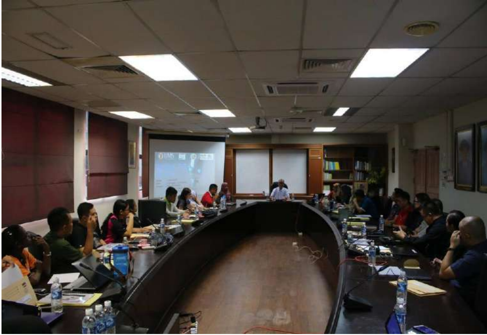
Gambar 9: Bengkel TOT bersama pelajar-pelajar TESL FPPambilan 2015/2016 bersama guru-guru dari daerah Tuaran.