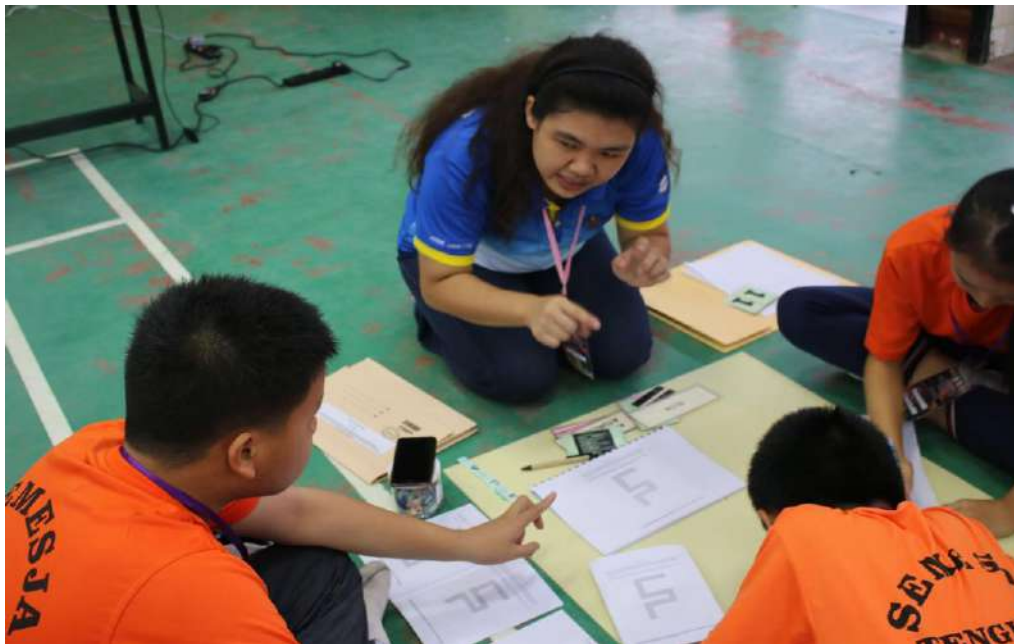
Gambar 14: Seorang pelajar pendidikan TESL menerangkan konsep Pemikiran Komputasional kepada murid-murid.