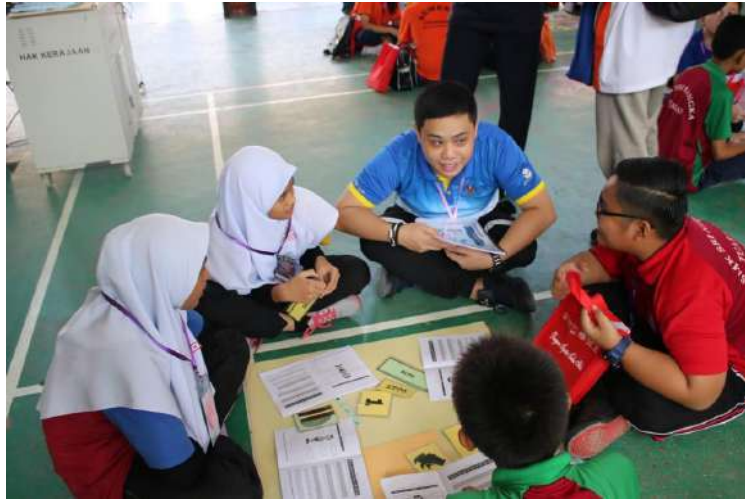
Gambar 7: Mahasiswa UMS sebagai fasilitator kepada pelajar.