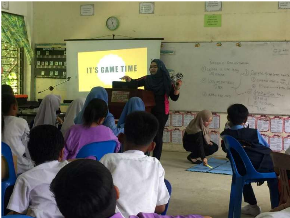
Gambar 18: Pelajar TESL mengintegrasikan penggunaan robot minimalis dalam pembelajaran Bahasa Inggeris di SK Daingin, Papar.