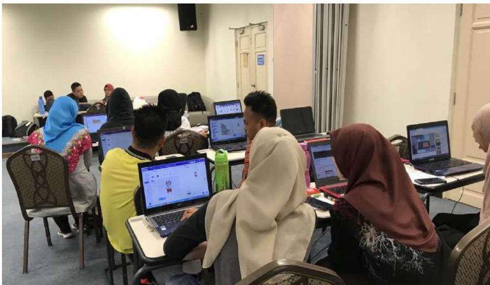
Gambar 21: Bengkel TOT untuk pelajar DPLI

Pada tahun 2019, pelajar Diploma Pendidikan Lepas Ijazah (DPLI) dan beberapa orang pelajar sarjana telah mengikuti TOT yang sama. Mereka dilatih oleh beberapa fasilitator robotik minimalis termasuk alumni-alumni sarjana muda sebelum mereka. Mereka dilatih untuk menggunakan dan mengintegrasikan perisian di dalam komputer riba dan cara penggunaan robot minimalis dijadikan sebagai permainan (gamifikasi). Antara matapelajaran yang diajar diintegrasikan dengan gamifikasi untuk program ini ialah Sains, Matematik, Bahasa Melayu, Bahasa Inggeris dan Pendidikan Jasmani. Mereka dilatih bagi melakukan Program Pendidikan Revolusi Industri 4.0: Gamifikasi di SK Ulu Kukut, Kota Belud. SK Ulu Kukut terletak di Kampung Ulu Kukut iaitu sebuah perkampungan yang terletak di sempadan Kota Belud dan Kota Marudu. Berkeluasan 10 hektar dan ia berdekatan dengan kawasan Hutan Simpan Ulu Kukut dan mempunyai struktur tanah berbukit-bakau. Kampung Ulu Kukut mempunyai seramai 500 orang penduduk dengan bilangan rumah sebanyak 72 buah. Majoriti penduduk kampung ini merupakan orang Dusun Tebilong dengan pelbagai agama yang dianuti. Hal yang demikian menjadikan program yang dijalankan di SK Ulu Kukut merupakan salah satu pemupukan STEM dalam kalangan pelajar di luar bandar. Program tersebut mendapat maklum balas yang baik terutamanya dari murid-murid SK Ulu Kukut dan guru-guru yang mengajar di sana.