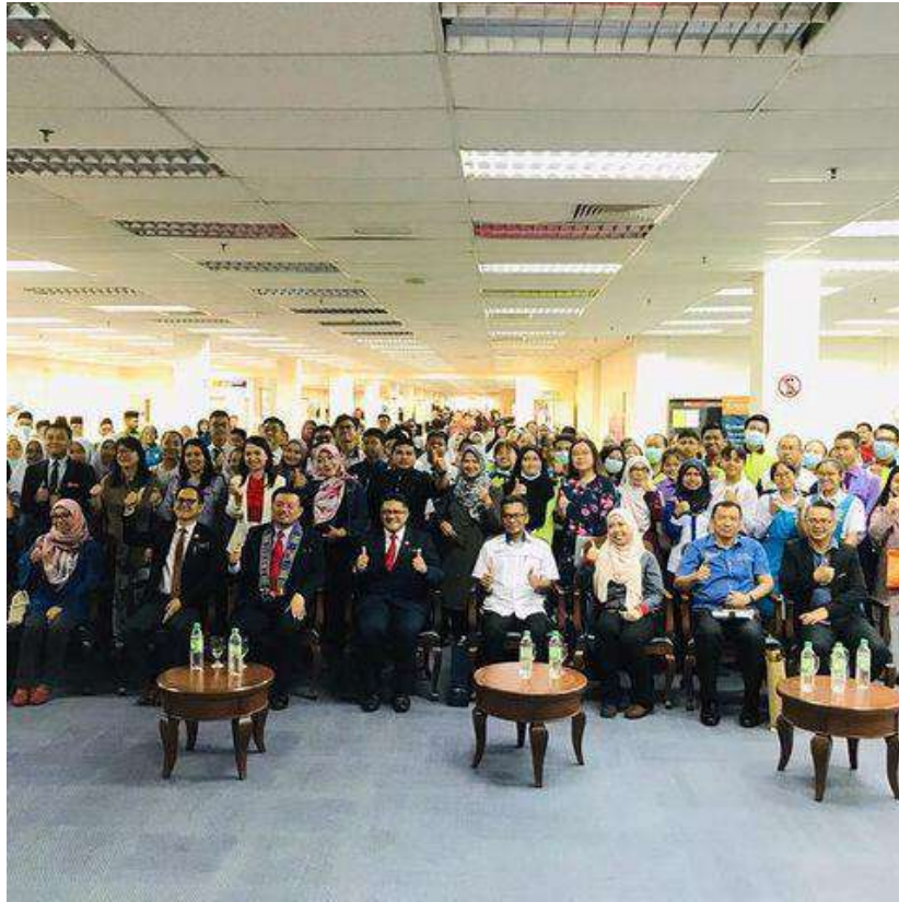
Gambar 1: Majlis Perasmian Program STEM4ALL di Perpustakaan UMS