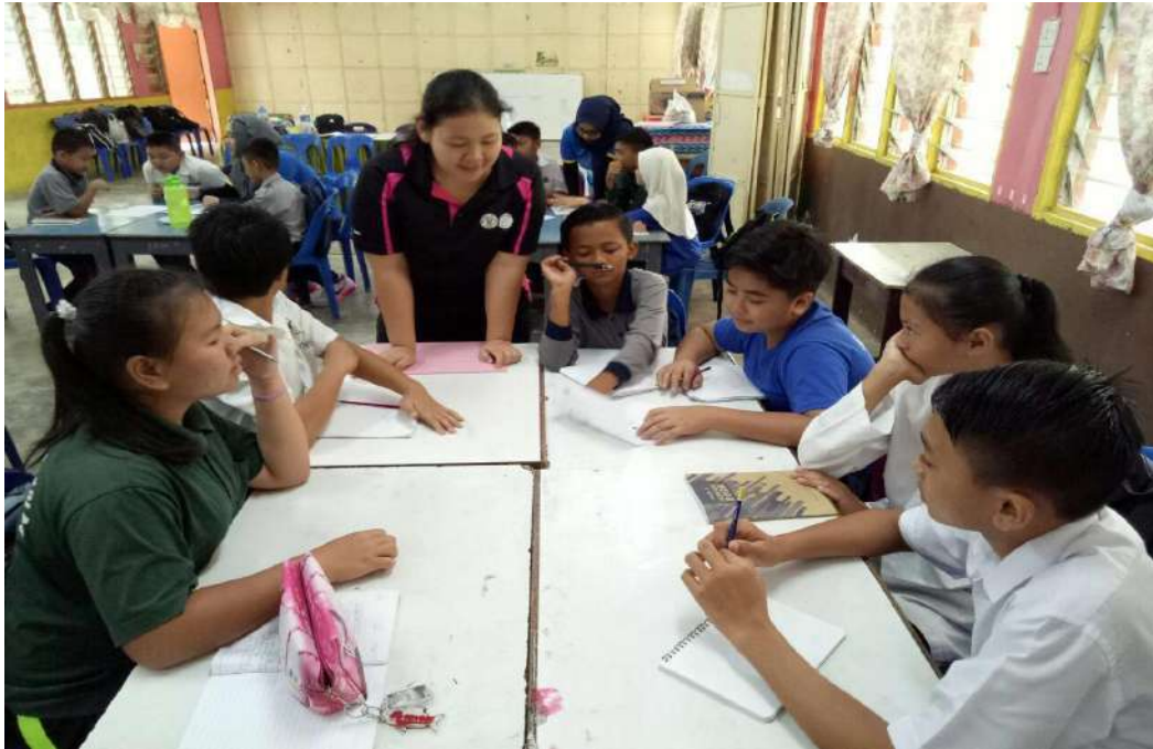
Gambar 17: Seorang pelajar TESL memberikan penerangan kepada murid-murid SK Daingin sebelum memulakan aktiviti bersama robot minimalis.