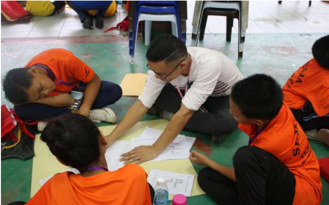
Gambar 13: Seorang guru menerangkan konsep Pemikiran Komputasional kepada murid-murid sekolahnya.