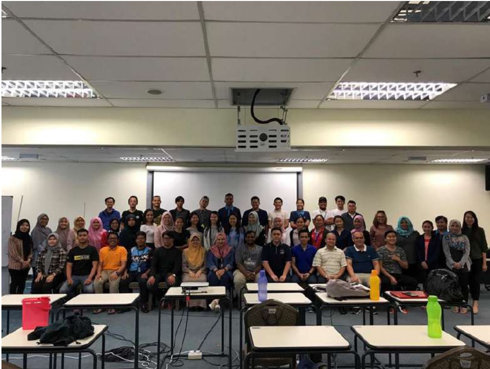
Gambar 22: Pelajar-pelajar DPLI dan pelajar sarjana bersama fasilitator bengkel TOT.