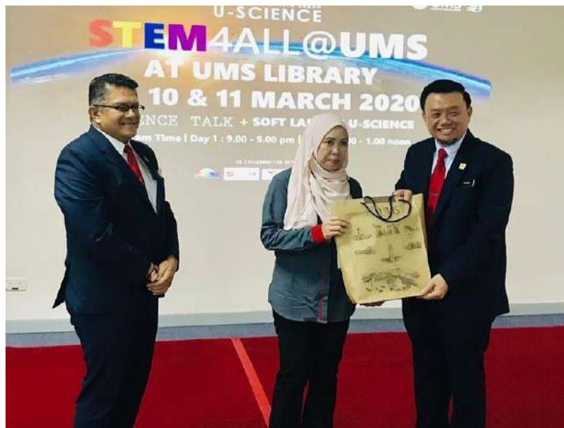
Gambar 2: Majlis Perasmian Program STEM4ALL di Perpustakaan UMS Bersama Naib Canselor UMS