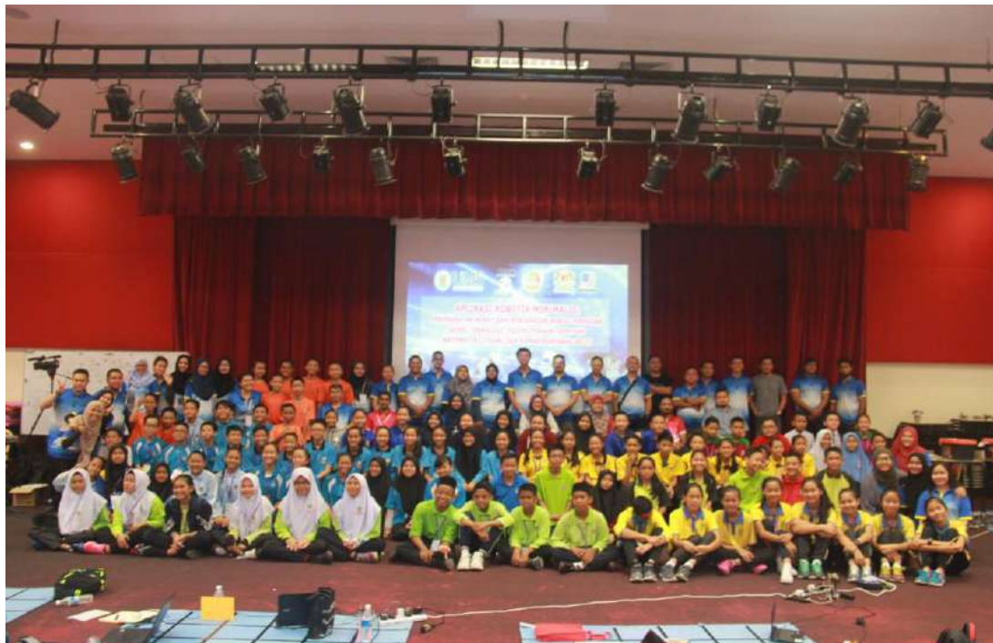
Gambar 12: Fasilitator Bengkel TOT, guru-guru dan mahasiswa mahasiswi (bakal guru) semasa bengkel Program Aplikasi Robotik Minimalis: Peningkatan Minat dan Pencapaian Murid Terhadap Sains, Teknologi, Kejuruteraan, Seni dan Matematik (STEAM) dan Kemahiran Abad ke-21