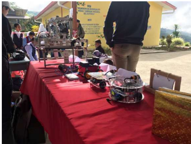
Gambar 5: Model Robot yang digunakan semasa program STEM4ALL.

Sebagai rumusan, walaupun pihak UMS adalah institusi tinggi yang tertumpu kepada pendidikan di peringkat pengajian tinggi, UMS turut berusaha dalam melibatkan pelajar di sekolah rendah dan sekolah menengah sebanyak yang mungkin. Aktiviti seperti program minimalis robotik dan STEM4ALL yang telah dikemukakan sebelum ini sedikit sebanyak telah memberi asas kepada pelajar untuk mengambil minat dengan aktiviti berkaitan dengan STEM.