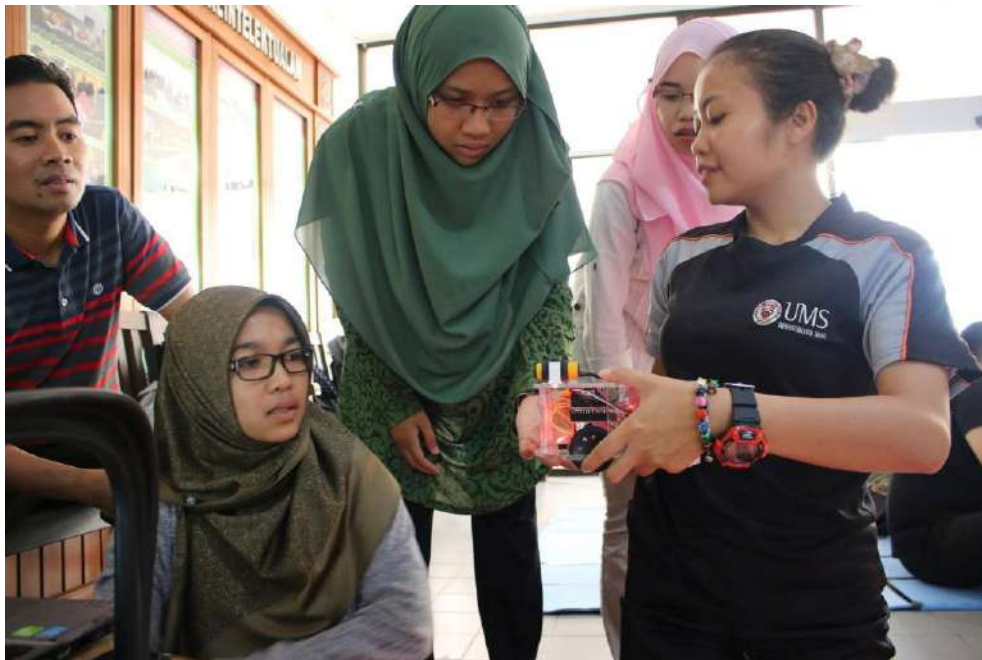
Gambar 10: Fasilitator Bengkel TOT memberikan penerangan kepada guru dari daerah Tuaran dan pelajar pendidikan.