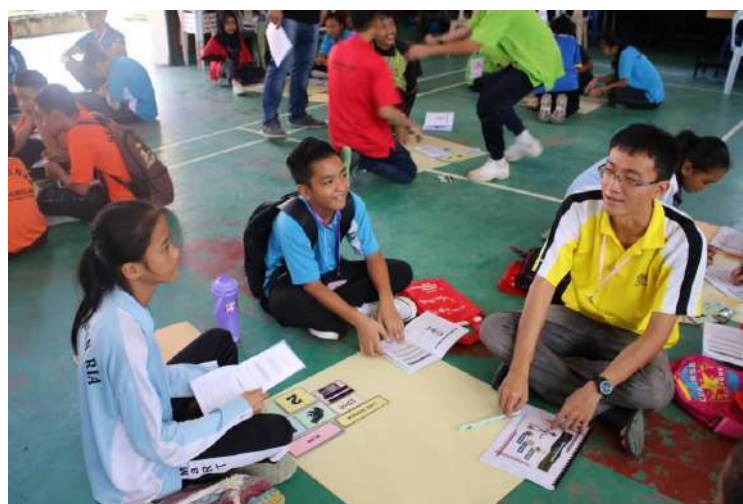
Gambar 6: Guru sekolah sebagai fasilitator kepada pelajar.

Berdasarkan hal yang telah dikemukakan, pihak Universiti Malaysia Sabah telah melatih beberapa mahasiswa dan mahasiswi daripada fakulti pendidikan di UMS dan guru daripada beberapa sekolah di Kota Kinabalu dan Tuaran untuk menjadi fasilitator dalam kursus TOT minimalis robotik. Fasilitator program minimalis robotik ini akan menggunakan kemahiran yang baru dipelajari daripada bengkel TOT dan mengajarnya kepada pelajar-pelajar sekolah. Sebagai contoh, pada tahun 2017 di mana Projek Aplikasi Robotik Minimalis telah dianjurkan di Tamparuli yang melibatkan beberapa pelajar yang terpilih untuk mewakili sekolah masing-masing. Dalam projek tersebut, setiap sekolah akan dibentuk sebagai satu kumpulan dan bagi setiap kumpulan ini, terdapat dua fasilitator (mahasiswa/mahasiswi daripada UMS dan guru daripada sekolah tersebut) yang akan mengajar langkah demi langkah penggunaan robot minimalis yang diberi nama “Comel”. Salah satu objektif projek tersebut ialah untuk memberi pendedahan kepada pelajar sekolah mengenai pengintegrasian robotik dalam pembelajaran serta berkongsi apa yang mereka telah pelajari pada hari tersebut kepada rakan-rakan mereka yang belum pernah berpeluang untuk mengikut program robotic minimalis.