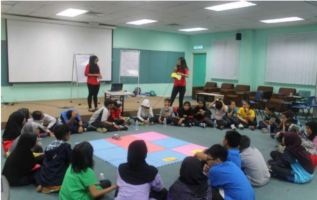
Gambar 15: Pelajar-pelajar TESL melakukan aktiviti “hands on” yang menggunakan robot minimalis sebagai bahan pengajaran. Mereka mengintegrasikan robotik kedalam pengajaran Bahasa Inggeris