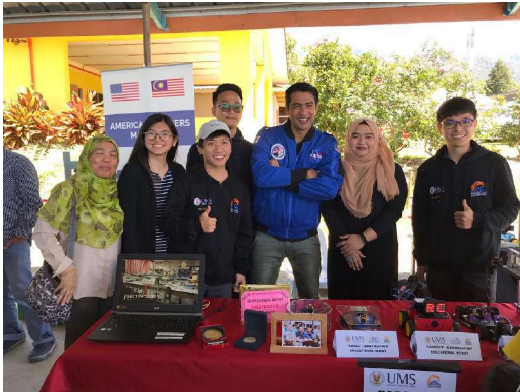
Gambar 3: Pameran Robotik Mahasiswa UMS semasa program STEM4ALL

Objektif program tersebut adalah untuk mengubah industri pendidikan Malaysia melalui promosi pendidikan STEM di kalangan rakyat Malaysia dan memastikan bahawa siswazah dilengkapi dengan kemahiran yang tepat di era digital semasa.