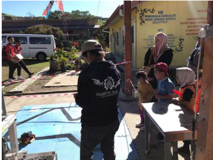
Gambar 4: Aktiviti robotic bersama pelajar semasa Program STEM4ALL di Kundasang.