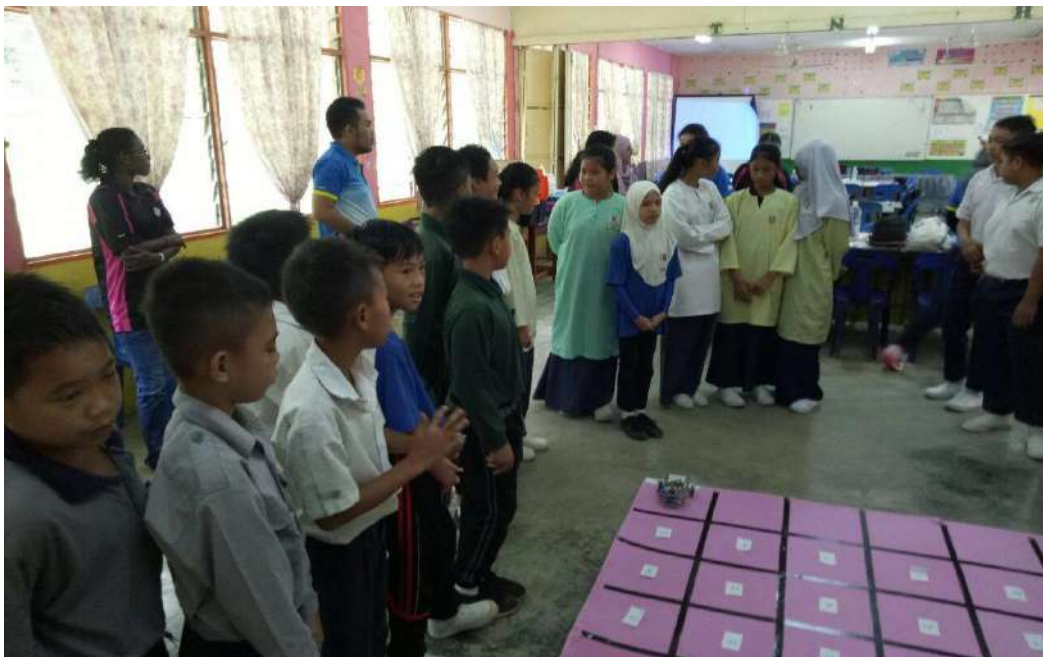
Gambar 16: Murid-murid SK Kayau bersedia untuk melakukan aktiviti. Menggunakan robot minimalis dalam gamifikasi.