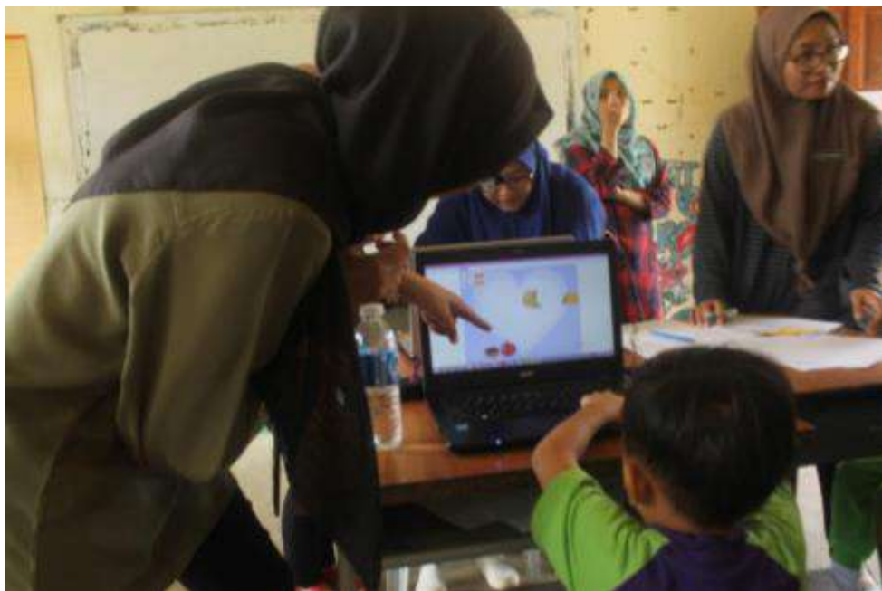
Gambar 23: Pelajar DPLI memberikan keterangan kepada pelajar SK Ulu Kukul yang sedang melakukan aktiviti secara “hands on”.