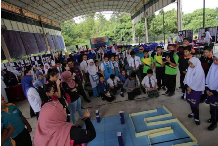
Gambar 26: Fasilitator dari UMS menunjukkan demo kepada pelajar sekolah yang terlibat mengenai inovasi mereka.