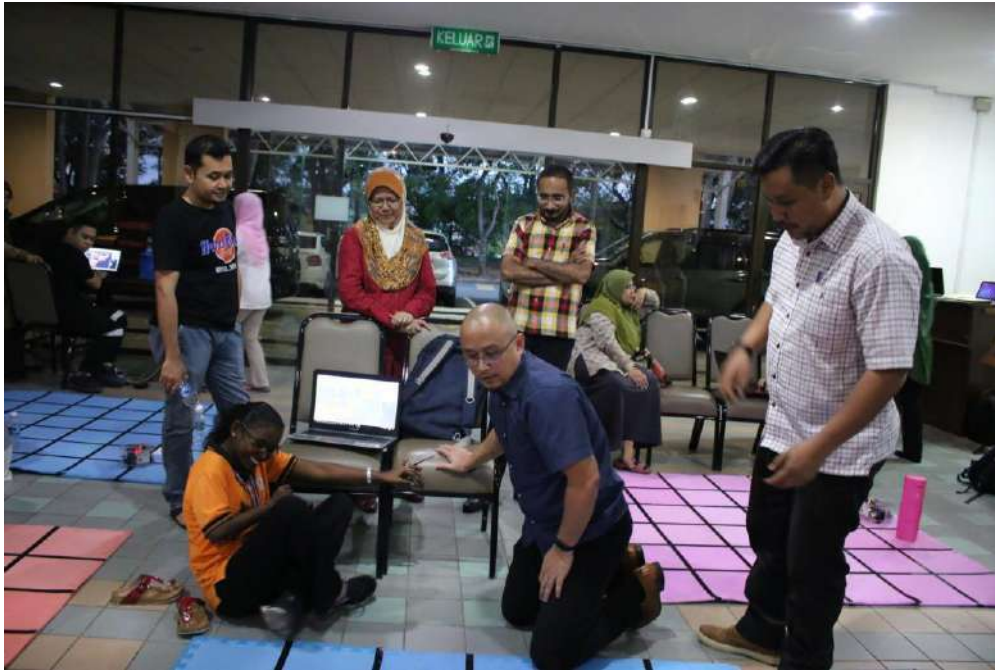
Gambar 11: Guru-guru dan bakal guru dibimbing oleh fasilitator TOT mencuba aktiviti secara “hands on”