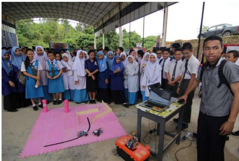
Gambar 27: Pelajar-pelajar yang terlibat melakukan aktiviti “hands on”