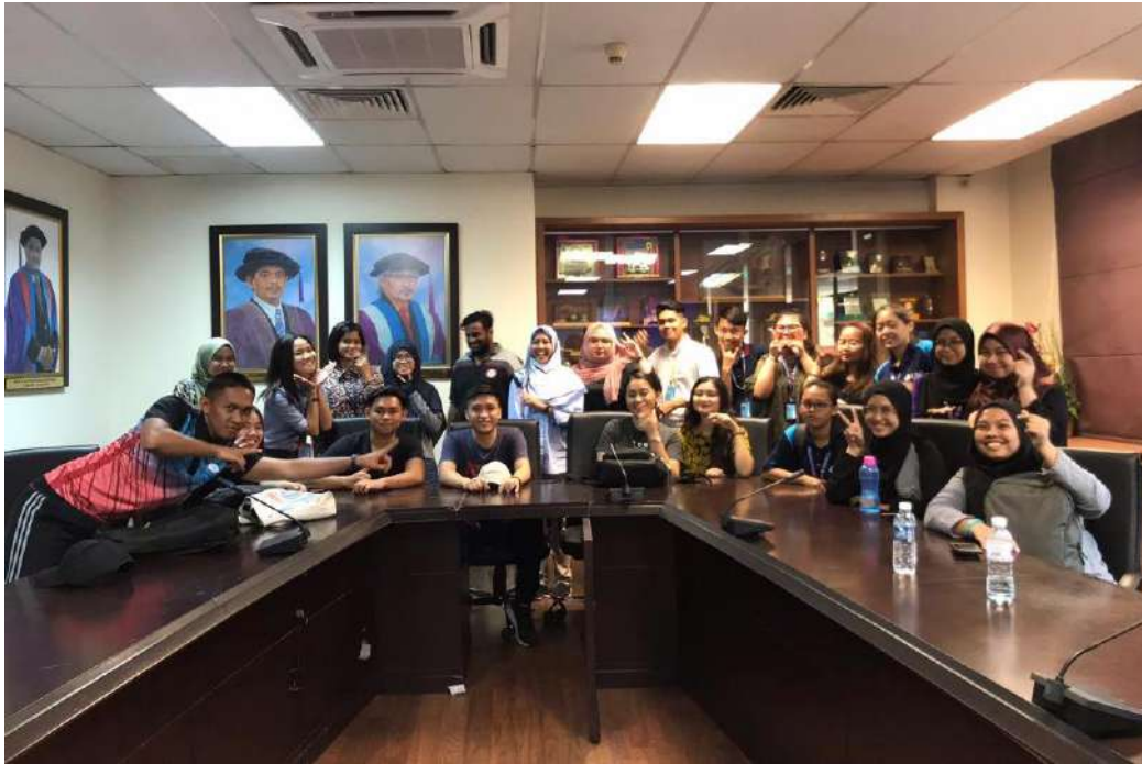
Gambar 19: Bengkel TOT kepada pelajar TESL ambilan 2018/2019 dan 2019/2020 (STEM AMBASSADOR) untuk Program English Language Camp with Integration of STEAM