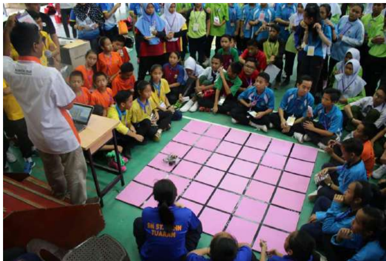
Gambar 8: Pelajar mengaplikasikan ilmu yang dipelajari semasa Projek Aplikasi Robotik Minimalis