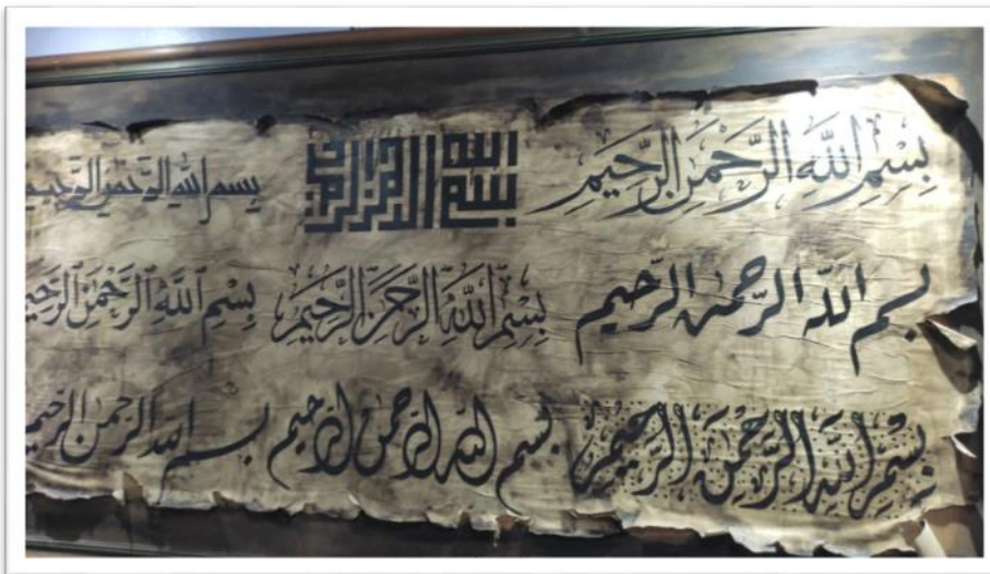
Gambar1: Seni kaligrafi yang ditunjukkan di Yayasan Restu

Kemudian harini, Yayasan Restu sudah memiliki kaligrafi-kaligrafi atau penulis khat yang dibawa dari India, Mesir untuk ditempatkan di Nasyrul Quran. Yayasan ini telah menjadi pusat rujukan untuk manuskrip, warna dan reka bentuk Islam serta pusat cenderahati dan kraf Islam. Yayasan ini telah membawa gaya yang unik dalam memelihara seni mushaf dengan menghasilkan pelbagai jenis mushaf tulisan tangan yang dihias penuh; disertai terjemahan dalam pelbagai bahasa. Tugas-tugas penyelidikan dan pembangunan yang terperinci dilakukan sebelum sebarang kerja lain dilaksanakan. Pusat kesenian ini mempunyai lebih daripada 11 jabatan yang masing-masing menghasilkan produk yang menggabungkan unsur-unsur kesenian Islam. Dengan ini, dijadikan sebagai usaha sambungan Yayasan Restu untuk mewujudkan banyak lagi manuskrip-manuskrip yang ditulis tangan, jenis cetakan dalam pelbagai jenis al-Quran. Usaha-usaha seperti ini akan memberikan keyakinan kepada Yayasan Restu untuk terus maju ke hadapan dan menjadikan al-Quran sebagai tunggak perjuangan umat Islam. (Nasyrul Qur'an, 2002)