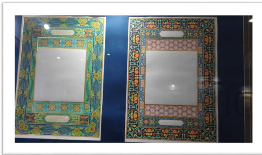
Gambar 3: Keindahan seni pada rangka Salinan helaian mushaf yang memaparkan motif buah-buahan bagi menarik minat kanak-kanak untuk membaca al-Qur'an.

Setelah penulis khat membuat beberapa salinan, ia akan dirujuk kepada mushaf sedia ada yang sudah diperakui kesahihannya, seterusnya salinan itu juga akan diperiksa oleh beberapa penghafaz al-Quran. Mereka akan memeriksa setiap inci penulisan yang disediakan oleh penulis antaranya jarak baris pada huruf. Berbeza di kilang percetakan Nasyrul Qur'an di Putrajaya, di situ hampir 90 peratus operasi menggunakan mesin yang bernilai jutaan ringgit dan selebihnya memerlukan ketajaman mata pekerja untuk memeriksa setiap helaian al-Quran yang sudah dijadikan mushaf.