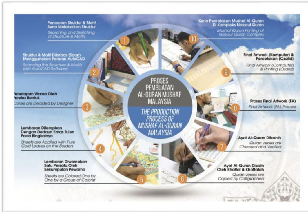
Gambar 2: Proses pembuatan al-Qur'an mushaf di Yayasan Restu dan Nasryul Qur'an.

Penulisan ayat al-Quran berkembang pesat setelah kewafatan Nabi Muhammad SAW demi menjaga kesuciannya apabila tercetusnya perang Yamamah 69 yang menyebabkan syahidnya ribuan huffaz al-Qur'an melalui ijhtihad para sahabat. Setelah itu, al-Quran ini dibukukan pada zaman pemerintahan khalifah Islam ketiga, khalifah Uthman R.A. Kemudian pada hari ini, muncul satu seni iaitu seni hiasan al-Quran yang merangkumi kaligrafi, tanda baca, tanda ayat, hiasan muka surat, warna dakwat, penjilidan dan kulitnya.