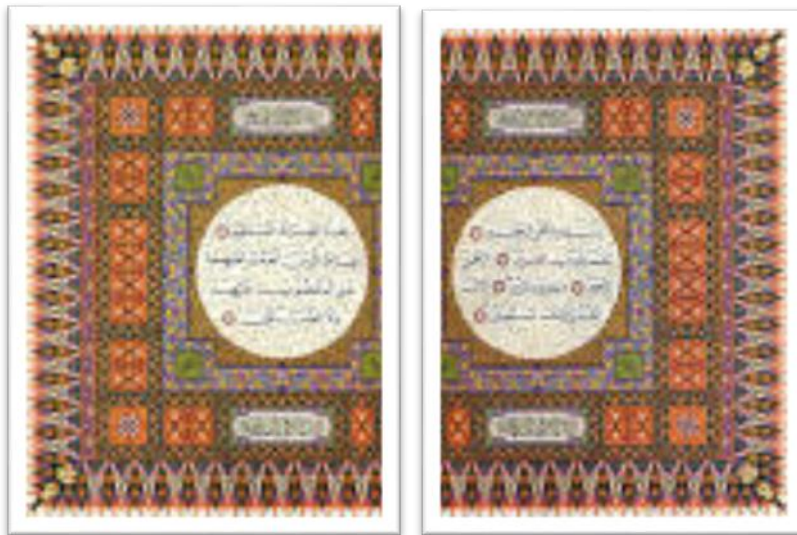
Gambar 6: Ilustrasi Hiasan Corak Dan Motif Budaya Melayu Di Helaian Mushaf Al-Qur’An.

Pertama , Mushaf al-Quran Malaysia Taba’ah Ma’ārij al-Jamal (Cetakan awam): Mushaf ini menggunakan percetakan berkualiti, memiliki corak dan motif budaya Melayu. Penggunaan hiasan corak yang cantik, di mana satu motif berbeza sebanyak 20 muka suratnya direka dan dijadikan sebagai hiasan setiap 20 muka surat yang berbeza pula dengan lembaran berikutnya. Sejumlah rekaan corak dan motifnya telah menghiasi setiap lembaran-lembaran mushaf ini yang berwarna-warni sehingga ke lembaran muka surat terakhir. Proses mewarnai dengan mengambil masa selama 5 (lima) tahun untuk disiapkan secara keseluruhannya.