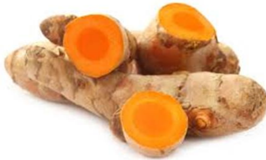
Gambar 5: Rizom Kunyit