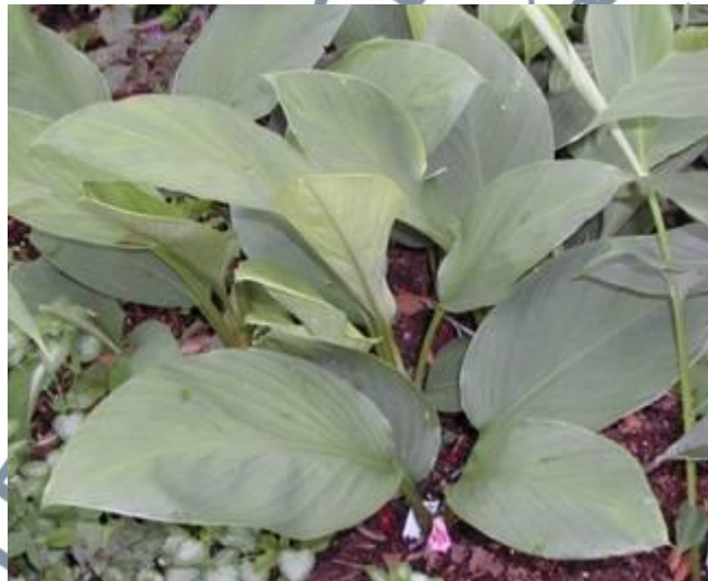
Gambar 10: Pokok Temu Kunci