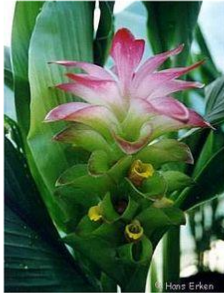
Gambar 13: Bunga Temulawak