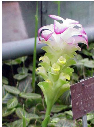
Gambar 14: Pokok Temu Hitam