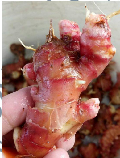
Gambar 17: Rizom Halia Bara

Sumber : https://myagri.com.my/2018/01/halia-bara/