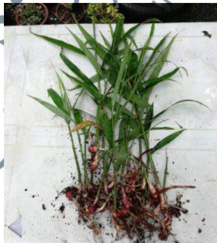
Gambar 16: Pokok Halia Bara