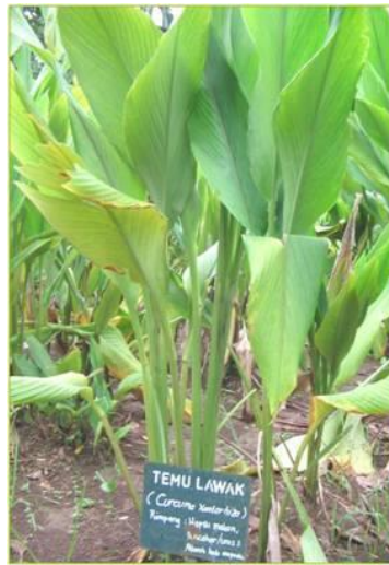
Gambar 12: Pokok Temulawak