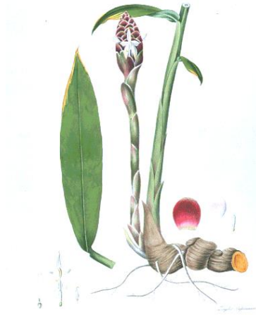
Gambar 18: Pokok Bonglai