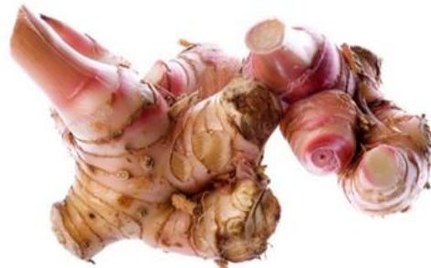
Gambar 7: Rizom Lengkuas