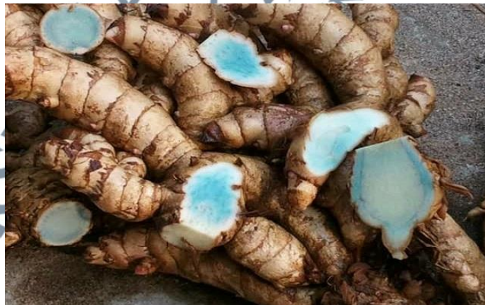
Gambar 15: Rizom Temu Hitam