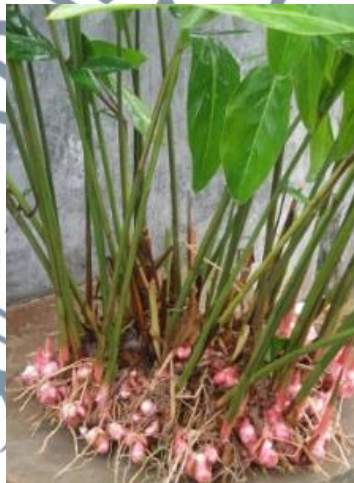
Gambar 8: Pokok Lengkuas