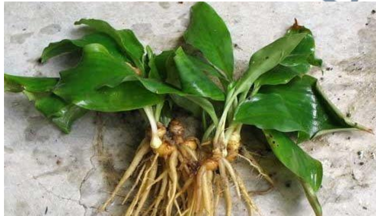
Gambar 4: Pokok Cekur