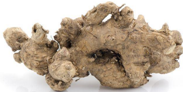
Gambar 2: Rizom Lempoyang

Lempoyang merupakan spesies halia. Jika diperhatikan, daun dan rizomnya juga hampir menyerupai halia. Lempoyang berdaun besar dan lebar serta mempunyai pelepah yang melekap pada batang. Batangnya berwarna hijau muda dan akar bertukar menjadi warna ungu apabila sudah tua. Apabila lempoyang dipotong, jelas kelihatan rizomnya yang berwarna kuning, rasanya sedikit pahit dan mempunyai bau yang kurang enak 88 .