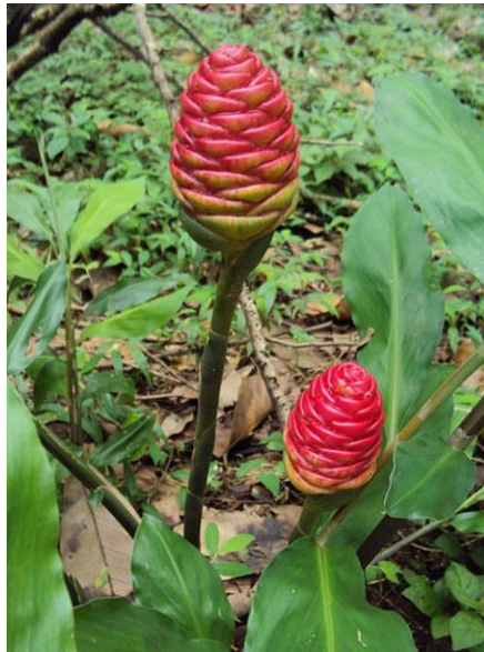
Gambar 3: Pokok Lempoyang