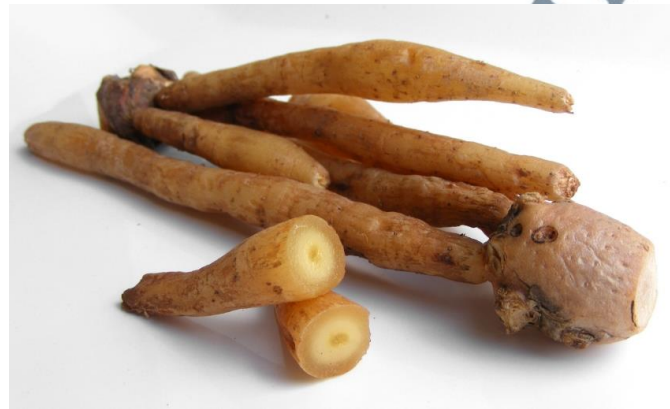
Gambar 9: Rizom Temu Kunci

(Indonesia), Koncih (Sumatera), Temu kunci (Minangkabau), Konce (Madura), Kunci (Jawa Tengah), Dumu kunci (Bima), Tamu konci (Makasar), Tumu kunci (Ambon), Anipa wakang (Hila-Alfuru), Aruhu Konci (Haruku), Sun (Buru) Rutu kakuzi (Seram), Tamputi (Ternate), Fingerroot (Inggeris), Krachai (Thailand) dan Chinese key (Cina) 141 .