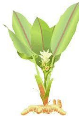
Gambar 6: Pokok Kunyit