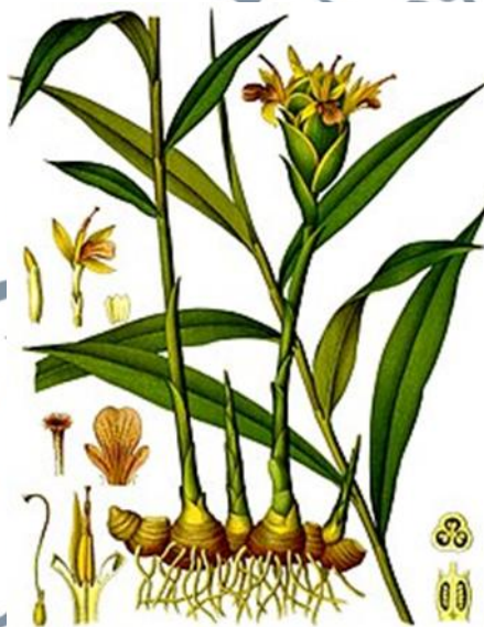
Gambar 1: Pokok Halia