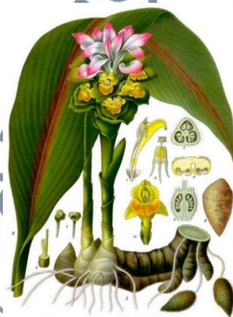
Gambar 11: Temu Putih

Temu putih atau nama saintifiknya Curcuma Zedoaria (Christm) Roscoe adalah salah satu spesies dari keluarga Zingiberaceae yang telah dikomersilkan penggunaan rizomnya sebagai tanaman ubat. Temu putih juga dikenali sebagai temu kuning yang mana telah digunakan dalam industri minyak wangi, pewarna dan sebagai ubat 162 .