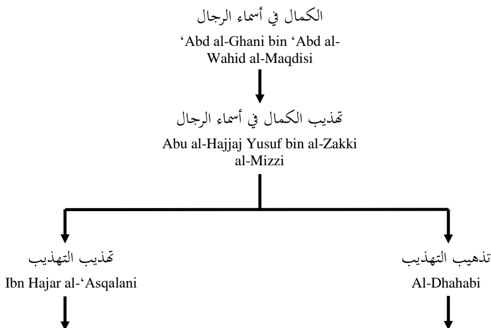
Rajah 1: Salasilah penghasilan kitab Al-Kasyif fi Ma'rifah Man Lahu Riwayah fi al-Kutub al-Sittah

Sebelum kitab ini dihasilkan, terdapat banyak kitab-kitab lain yang memuatkan biografi para perawi hadith dalam al-Kutub al-Sittah seperti kitab al-Mu'jam al-Musytamal 'ala Dhikr Asma' Syuyukh al-A'immah al-Nabal karangan 'Ali bin al-Hasan bin 'Asakir (m.571H). Kemudiannya disusuli dengan kitab al-Kamal fi Asma' al-Rijal karangan Abu Muhammad 'Abd al-Ghani al-Hanbali (m.600H), Tahdhib al-Kamal fi Asma' al-Rijal oleh Abu al-Hajjaj Yusuf bin al-Zakki al-Mizzi (m.742H), Ikmal Tahdhib al-Kamal karangan 'Ala' al-Din al-Maghalata'i (m.762H), Tahdhib al-Tahdhib dan Taqrib al-Tahdhib oleh Ibn Hajar al-'Asqalani dan Tadhhib al-Tahdhib oleh Imam al-Dhahabi. Imam al-Dhahabi kemudiannya meringkaskan kitabnya yang berjudul Tadhhib al-Tahdhib kepada sebuah kitab baru yang dinamakan sebagai Al-Kasyif fi Ma'rifah Man Lahu Riwayah fi al-Kutub al-Sittah (al-Tahhan, 1996). Salasilah penghasilan kitab ini adalah seperti yang terdapat dalam rajah berikut: