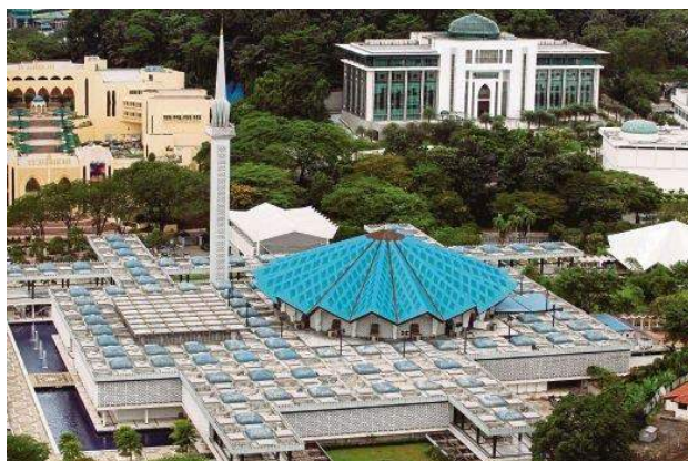
Gambar 2: Masjid Negara yang berbentuk seakan-akan payung adalah antara seni bina tempatan yang amat dikagumi.

Dengan melaksanakan konsep asas susun atur dan reka bentuk, ruang serambi di Masjid Negara masih berjaya melaksanakan peranan yang hampir sama dengan serambi rumah Melayu: ruang menyambut kedatangan pengunjung dan menyediakan suasana yang selesa untuk aktiviti tidak formal. Hal yang sama boleh dilihat pada bangunan Parlimen yang menerapkan unsur seni bina Melayu dalam reka bentuknya. Misalnya, bumbung panjang di podium bangunan tersebut menunjukkan reka bentuk bumbung panjang rumah Melayu tradisional di Melaka. Akan tetapi, pengadaptasian itu tidak dilakukan per se, kerana telah disertakan daya inovasi yang melibatkan teknologi konkrit bertetulang untuk menonjolkan struktur kekuda bumbungnya di bahagian luar (Kamarul Afizi & Nik Lukman, 2007: 281).