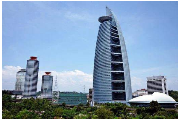
Gambar 4: Menara Maybank, yang diilhamkan daripada bentuk keris Melayu dan Menara Telekom, yang mendapat inspirasi daripada hasil karya seniman tersohor, A Latiff Mohidin berjudul Pago-pago.