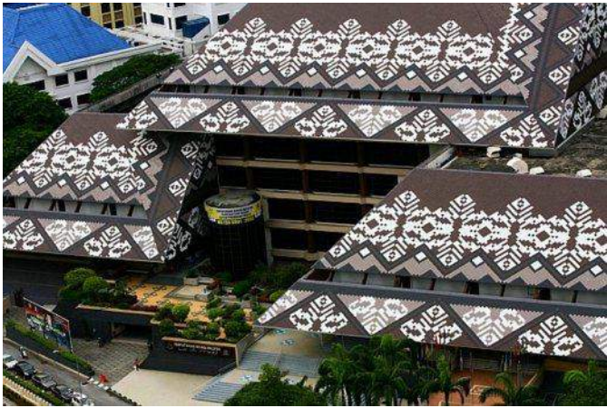
Gambar 3: Rekaan bangunan Perpustakaan Negara Malaysia yang menampilkan elemen songket.