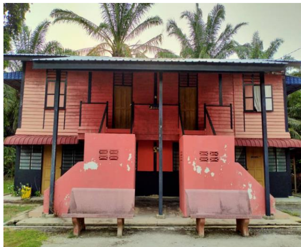
Gambar 4: Bangunan baru dua tingkat Madrasah Nadwah al-Tullab yang mula dipakai sekitar tahun 1986. Kini tingkat atas dijadikan tempat sembahyang, tingkat bawah sebagai pusat sumber.