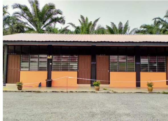
Gambar 5 dan 6: Bangunan kelas Madrasah Nadwah al-Tullab yang baru yang ada pada hari ini.