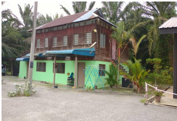
Gambar 7: Rumah Wakaf Madrasah Nadwah al-Tullab. Di rumah ini Tuan Guru Haji Othman Qarib tinggal semasa beliau menjadi mudir sebelum berpindah ke rumah sendiri.