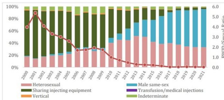
Rajah 1: Trend HIV berdasarkan mod jangkitan di Malaysia, 2000-2021 (Ministry of Health Malaysia, 2020)

Kajian menunjukkan bahawa kes jangkitan HIV dalam kalangan homoseksual semakin meningkat dan telah mengatasi jumlah jangkitan yang berpunca daripada perkongsian jarum suntikan dadah. Menurut laporan daripada KKM, 2024 pada peringkat awal penularan wabak HIV, penggunaan dadah secara suntikan merupakan punca utama jangkitan, merangkumi kira-kira 60 hingga 75 peratus daripada semua kes baharu yang dilaporkan. Walau bagaimanapun, prevalens kes dalam kalangan pengguna dadah suntikan mula menurun sejak tahun 2004. Manakala sejak tahun 2013, corak jangkitan HIV telah berubah apabila golongan lelaki yang melakukan hubungan sejenis MSM ( men who have sex with men ) mencatatkan jumlah jangkitan yang lebih tinggi berbanding punca lain.