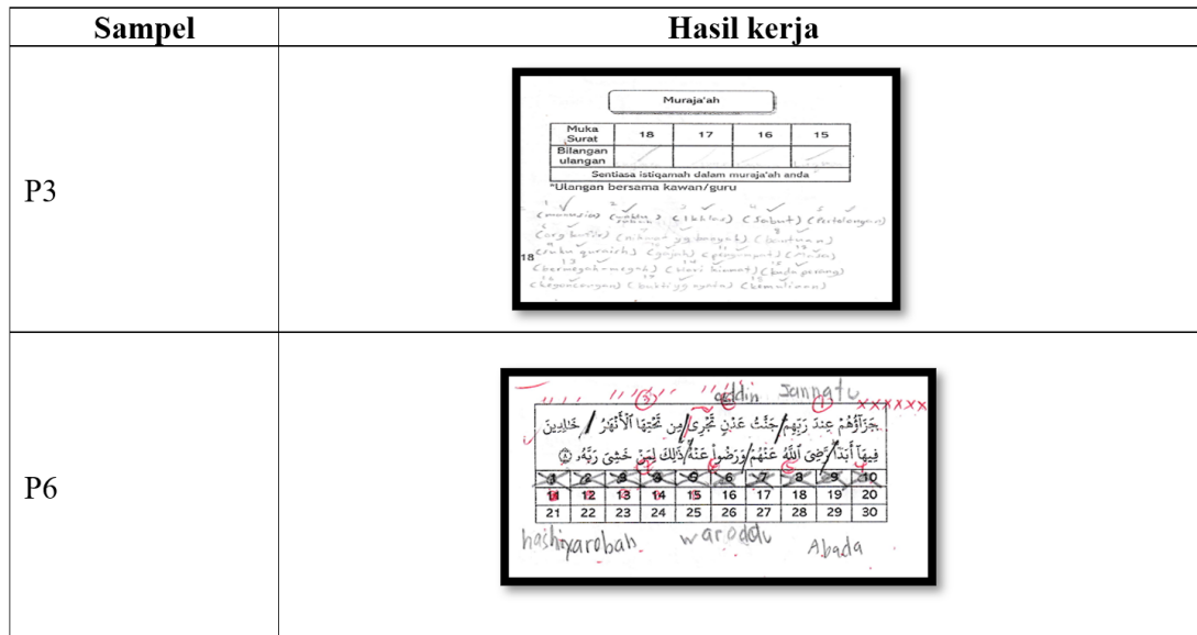
Rajah 4.3 Hasil kerja Inventori HAQAT oleh sampel P3 dan P6