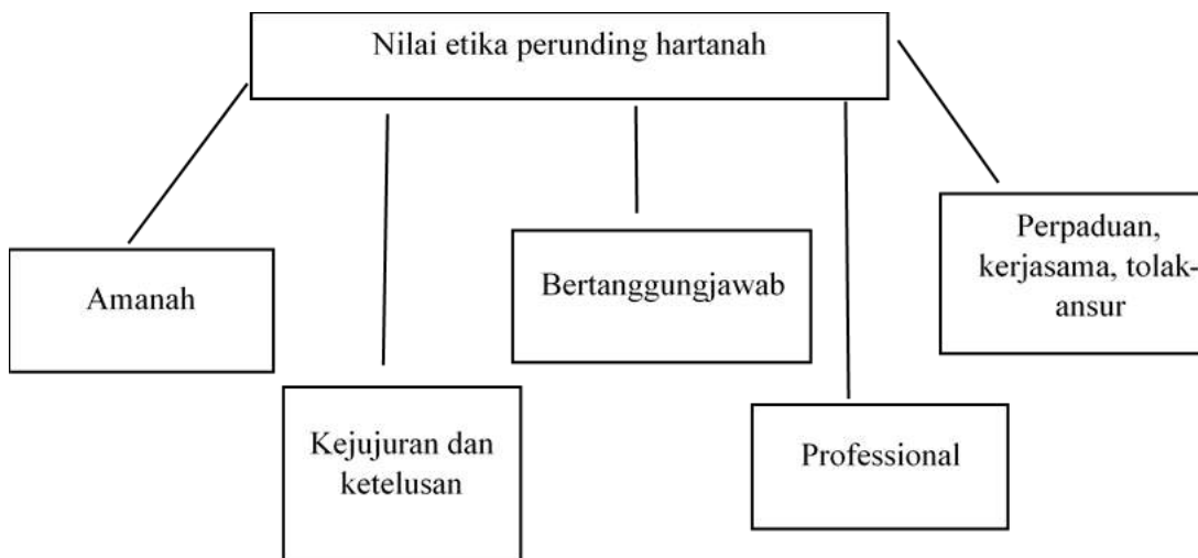
Rajah 1. Nilai Etika dalam kalangan Perunding Hartanah