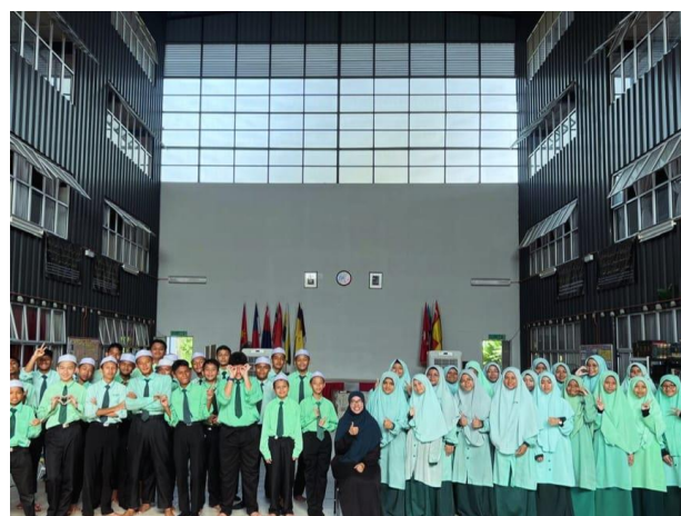
Rajah 5.2 Kerjasama Inventori HAQAT bersama Maahad Tahfiz Integrasi Sahabat Insani