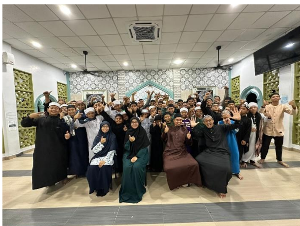
Rajah 5.1 Kerjasama Inventori HAQAT bersama Pusat Tahfiz Teknikal YUPP Pahang

Dalam usaha mengembangkan potensi Inventori HAQAT, langkah proaktif telah diambil dengan mendaftarkan reka cipta ini sebagai hak reka cipta di bawah nombor pemberitahuan CRLY2024W00585. Tujuan utama pendaftaran ini adalah untuk melindungi keaslian bahan yang telah dibangunkan serta meningkatkan kualiti Inventori HAQAT dan membuka peluang untuk kolaborasi dan penyebaran yang lebih luas dalam institusi pendidikan tahfiz. Perlindungan hak cipta ini juga membolehkan Inventori HAQAT berkembang dengan lebih sistematik dan teratur. Selain itu, Inventori HAQAT telah mendapat kepercayaan daripada Pusat Tahfiz Teknikal YUPP Pahang dengan membuka ruang untuk berkongsi penggunaan Inventori HAQAT terhadap pelajar mereka. Maklum balas yang positif daripada pelajar dalam melaporkan proses hafazan lebih baik dan tersusun melalui penggunaan Inventori HAQAT. Tambahan juga, Inventori HAQAT turut memperluaskan kerjasama dengan Maahad Tahfiz Integrasi Sahabat Insani di mana pelajar di institusi tersebut juga memberikan pandangan yang positif. Mereka menunjukkan minat yang tinggi terhadap kaedah hafazan HAQAT yang terbukti melalui pertanyaan dan respons yang diberikan. Langkah ini menunjukkan bahawa Inventori HAQAT bukan sahaja berfungsi sebagai alat inovatif dalam meningkatkan kualiti hafazan tetapi juga sebagai aset yang dilindungi dan diiktiraf secara sah. Perlindungan ini memberikan jaminan kepada perkembangan selanjutnya dan mengukuhkan kredibiliti Inventori HAQAT dalam pendidikan tahfiz.