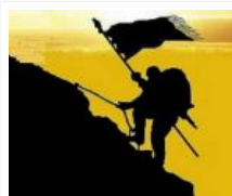
Meraih Cinta di Bulan Ramadhan