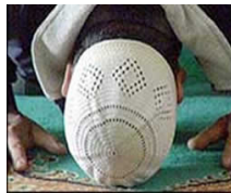
Ya Allah, Ku Mohon Rahmat-Mu (Do'a Al Qaradhawi)