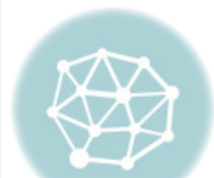
Pemimpin Pembawa Rahmat