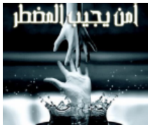
2 Ramadhan, Menghidupkan Hati dengan Berdoa Penuh Kehinaan