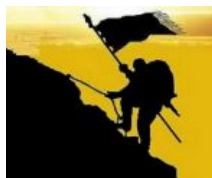
Meraih Cinta di Bulan Ramadhan