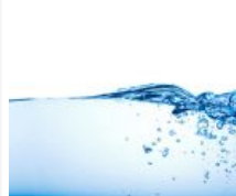
Saat Muslim Menjadi Rahmat, Perilaku Ramah Air