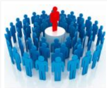
Pemimpin yang Mengilhami