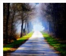
Biarkan Dakwah Membuka Pintu Cahayanya

Akses http://m.dakwatuna.com/ dimana saja melalui ponsel atau smartphone Anda.