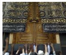
Pemegang Kunci Pintu Ka'bah Meninggal Dunia