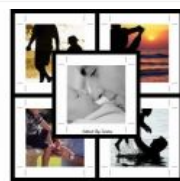
Mereka Adalah Pintu Surga yang (Mungkin) Sedang Tersia-Sia