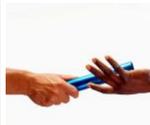
Fiqh Dakwah untuk Masyarakat Jawa: Kehinaan Adigang, Adigung, Adiguna