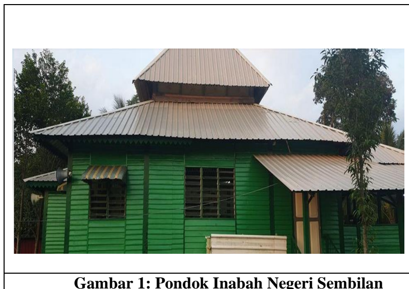
Gambar 1: Pondok Inabah Negeri Sembilan

Pusat-pusat inabah ini beroperasi secara sah dari segi undang-undang di mana ia bernaung di bawah PEMADAM. Sehingga kini Inabah telah berjaya memulihkan sejumlah penagih-penagih dadah dan juga muda-mudi yang bermasalah untuk membaiki diri dan seterusnya kembali semula ke pangkuan masyarakat (Izwa, 2021).