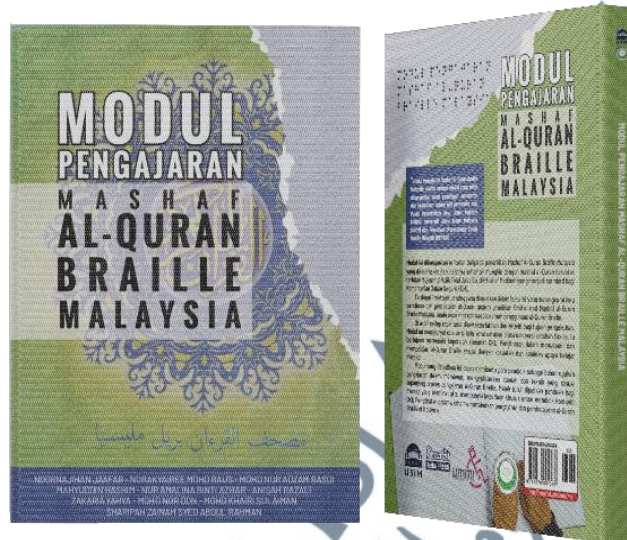
Rajah 4.3: MPQBM versi bercetakan

Rajah 4.3 dan Rajah 4.4 menunjukkan 2 buah MPQBM dalam 2 versi cetakan: