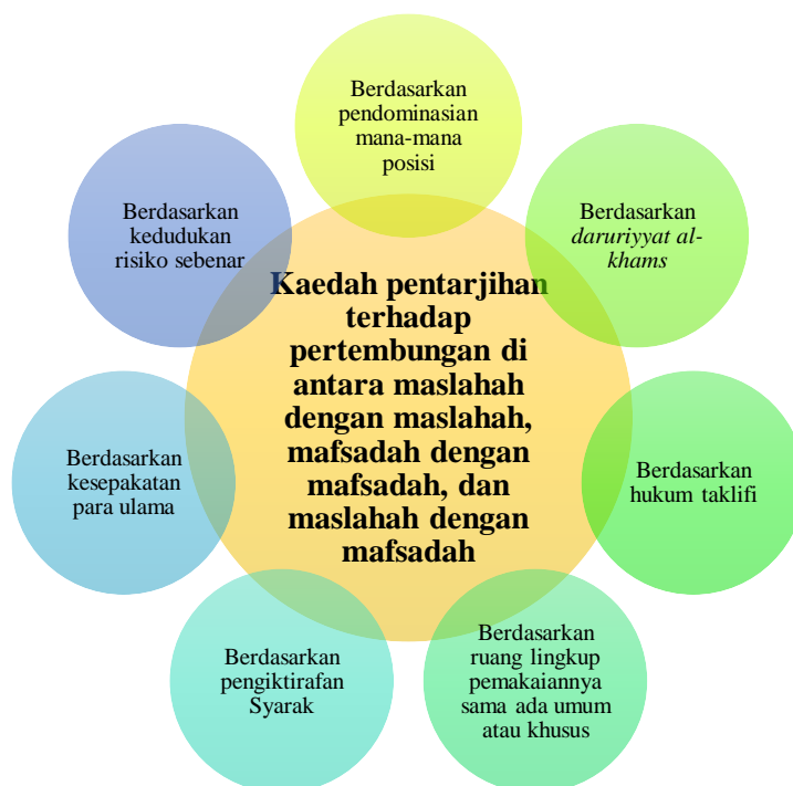
Rajah 2: Kaedah pentarjihan terhadap pertembungan di antara masalah dengan masalah, mafsadah dengan mafsadah, dan masalah dengan mafsadah (R. Ahmad, 2004; al-Shāṭibī, 2011; Ibnu Abdul Salam, 2020)

Manakala bagi kaedah pentarjihan terhadap pertembungan di antara masalah dengan mafsadah, para fuqaha telah menggariskan tujuh kaedah sepertimana pada Rajah 2 di bawah.