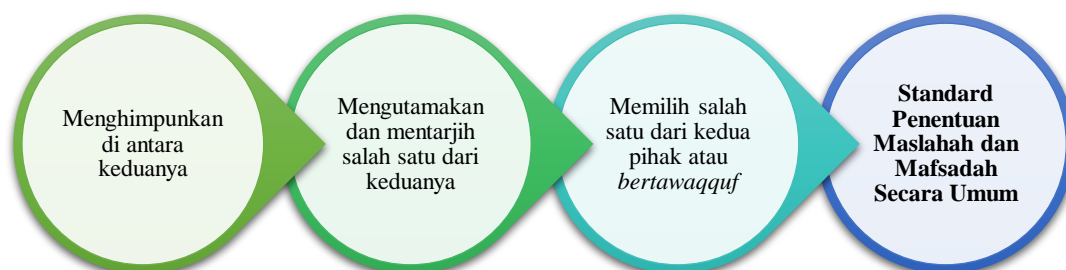
Rajah 1: Standard Penentuan Masalah dan Mafsadah Secara Umum (R. Ahmad, 2004; al-Shāfiʿī, 2011; Ibnu Abdul Salam, 2020)

Rajah 1 di atas menunjukkan tiga standard umum penentuan masalah dan mafsadah yang telah ditetapkan oleh para fuqaha terdahulu. Mereka telah menyusun standard penentuan ini ianya masih lagi relevan dan terpakai sehingga ke hari ini (R. Ahmad, 2004).