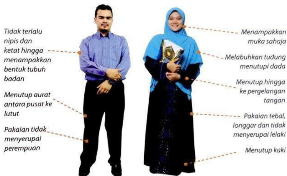
Gambar rajah 1. Pemakaian yang digariskan dalam Islam

Bagi lelaki, aurat yang wajib ditutup ialah kawasan di antara pusat dan lutut.